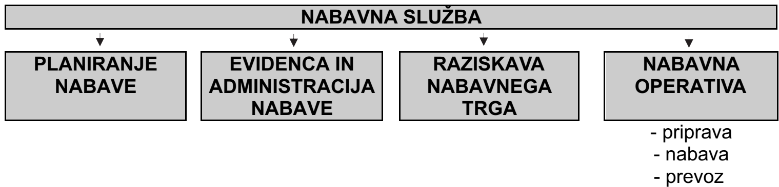
Slika št. 9: Organigram nabavne službe z delitvijo dela po dejavnostih

Taka organizacija je primerna za manjša do srednje velika podjetja. Pogosto en delavec opravlja več dejavnosti hkrati, na primer načrtuje nabavo in raziskuje nabavni trg.