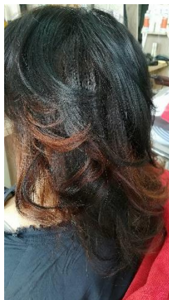
Slika 4: Kodranje las