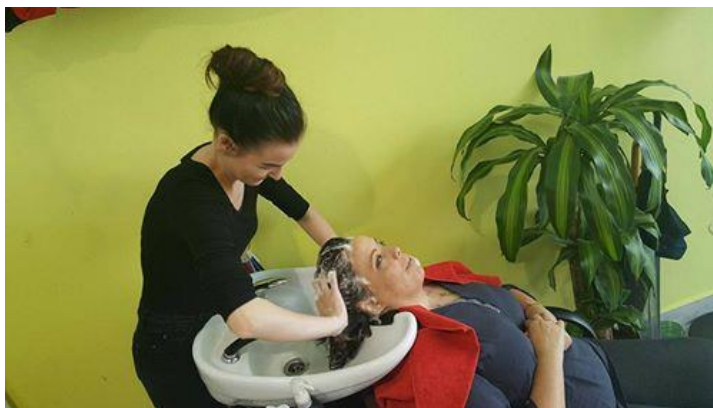
Slika 2: Umivanje las

Pri delu sem pazila na temperaturo vode, pri tem pa stranko vprašala, kakšna temperatura vode ji ustreza. Pazila sem, da ne bi bila tla mokra, saj to povzroča možnost zdrsa ter poškodb.