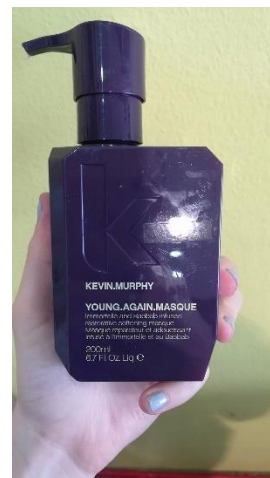
Slika 3: Šampon, balzam in maska Young again, Kevin Murphy