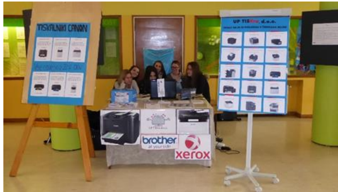
Stojnica UP Tiskra, d.o.o.

V času davčnih blagajn, so izdajale virtualne račune, ki so imeli napis: TEST – NI RAČUN.