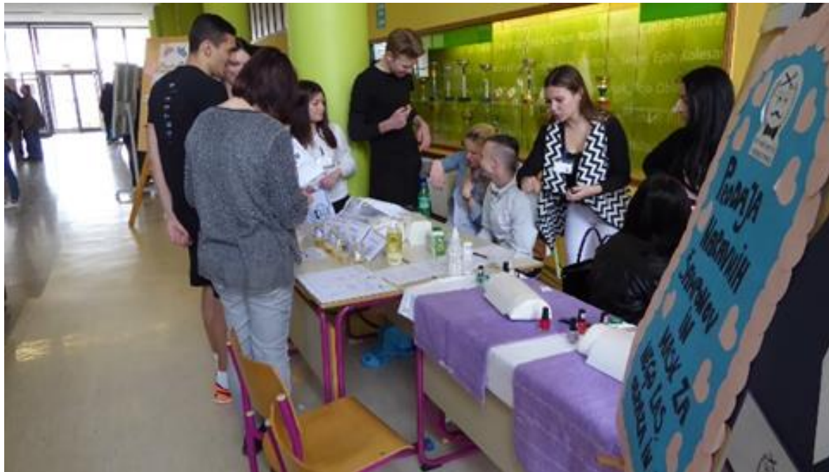
Stojnica UP Head lover d.d.

Imeli so posebno akcijo: obiskovalci so lahko kupili njihove izdelke in storitve po 1 EUR.