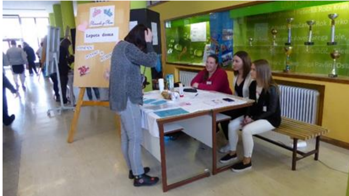
Stojnica UP Princeska in princ, d.o.o.

Po mizi so imele lično razporejeno promocijsko gradivo.