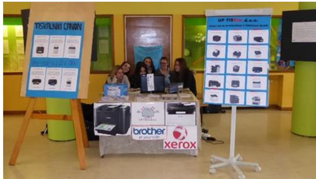
Stojnica UP Tiskra, d.o.o.

V času davčnih blagajn, so izdajale virtualne račune, ki so imeli napis: TEST – NI RAČUN.