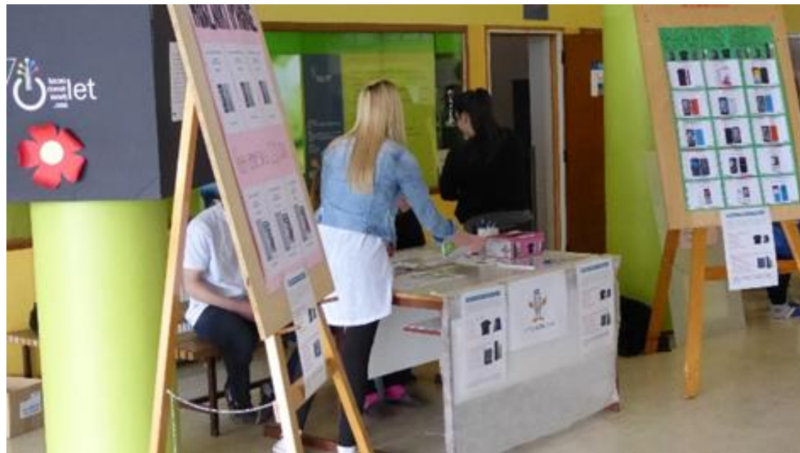
Stojnica UP Tele.mob, d.o.o.