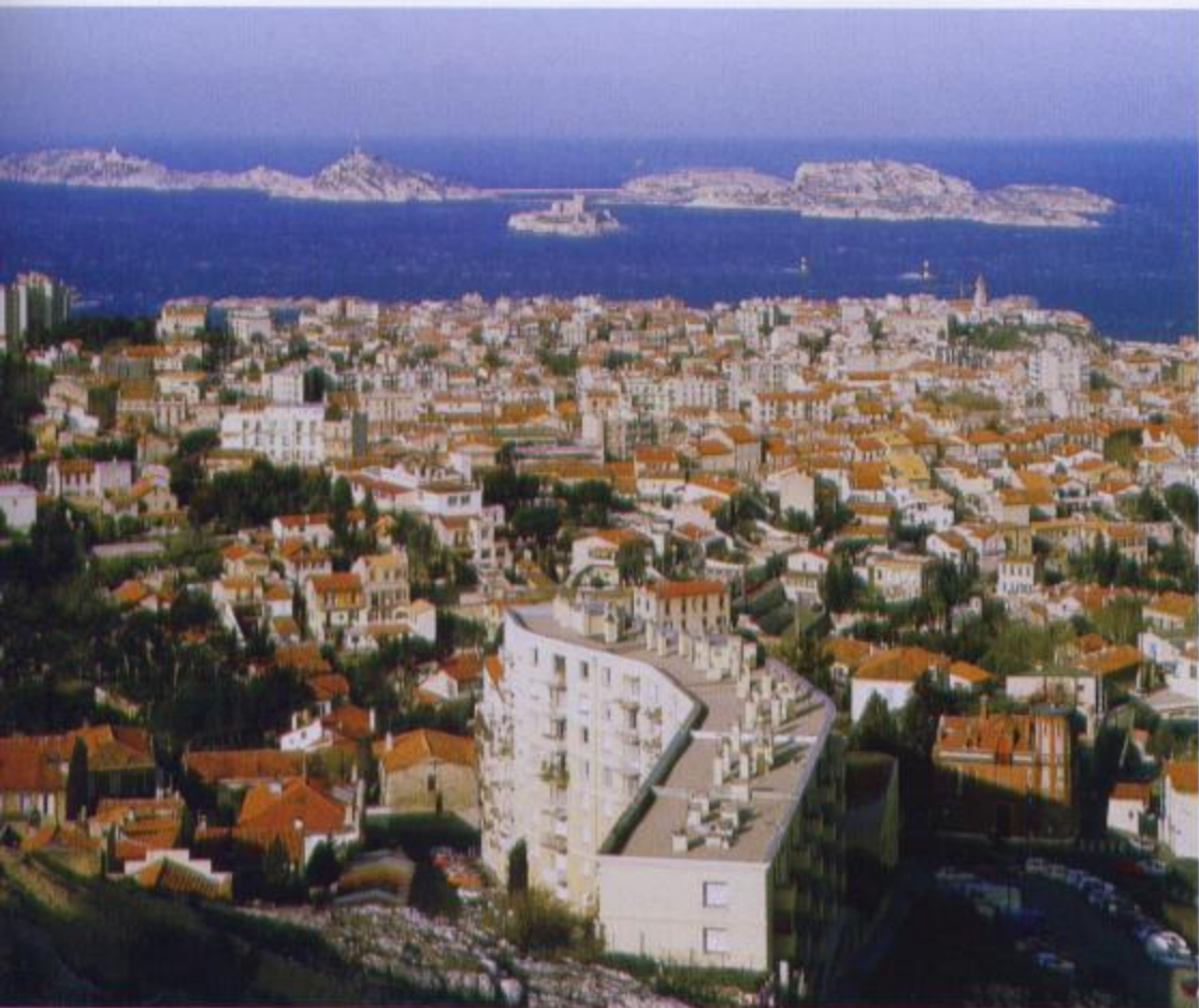
Spodaj: Marseille iz ptičje perspektive z otokom If in znamenitim gradom.