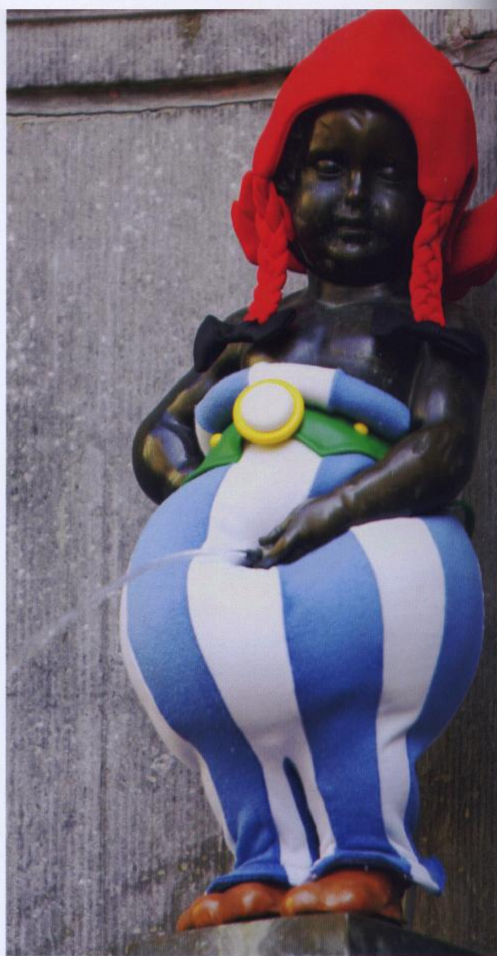
Manneken Pis v preobleki neuklonljivega Galca Obeliksa. Ta navada izvira iz časa volilnega kneza Maksimilijana II. Emanuela.

Bruseljsko središče. Zgodovina Grand Placea je zrcalna podoba zgodovine mesta. Kot trg in tržnico so ga ustanovili v 12. stoletju, potem pa je privlačil cehe in ne nazadnje tudi mestno upravo, da so okoli njega postavili svoje razkošne cehovske hiše, ki so pričale o njihovi blaginji. Bruselj in njegov trg sta postala v visokem srednjem veku eno najpomembnejših trgovskih in finančnih središč v Evropi. Do leta 1695 je bil Grand Place živahno prizorišče za trgovino in pretovarjanje. Potem so francoski topovi z bombardiranjem, ki je trajalo tri dni, končali to živahno dogajanje. Vse je bilo v ruševinah in pepelu. Danes je Grand Place spet srce Bruslja ter najljubše shajališče Bruseljčanov