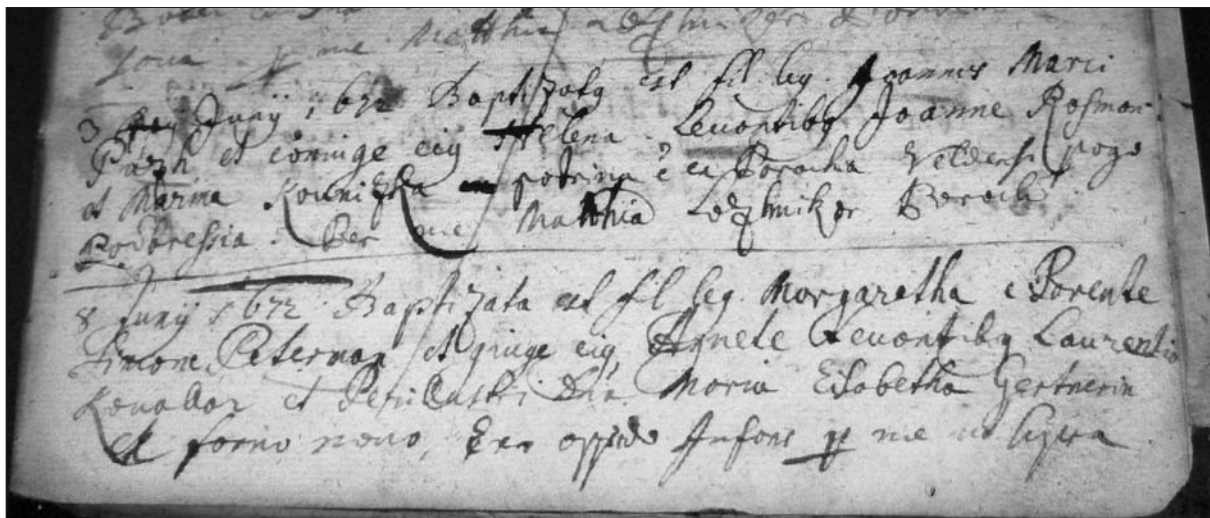
Prva znana pogojna omemba jeseniškega trga ( ex oppido ) v krstni matici 8. junija 1672 (NSAL, ZA Jesenice, Matične knjige, R 1650–1672, pag. 113).

oštevilčenje. 14 Plavž in Sava sta nato ostala samostojni naselji do prve polovice 20. stoletja. Podobno kot v nekaterih drugih industrijskih krajih na Slovenskem (Trbovlje, Zagorje, Hrastnik) se je več sosednjih krajev tudi tu zelo pozno združilo z osrednjim v enovito naselje. 15