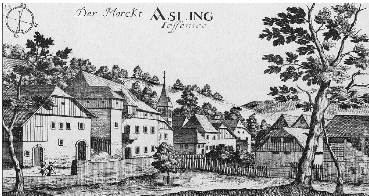
Jesenice po Valvasorjevi Topografiji Kranjske, 1679 (Valvasor, Topographia Ducatus Carnioliae Moderna , št. 13).

kot pričajo naknadni zapisi iz časa po letu 1660, še naraščalo. Bucelleni je imel poleg zemljišč novo kladivo, mlin, hišo pri plavžu, nov plavž in pri hiši novo žebljarno. Neagrarnih poklicev ta urbar ne beleži, pa tudi poklicna priimka najdemo med podružniki samo dva: po dva Puca in Pinterja. 44 Normativni podatki o cerkvi, prošenjih, županu, tlaki in drugih obveznostih vaške skupnosti so ostali enaki kot prej. 45