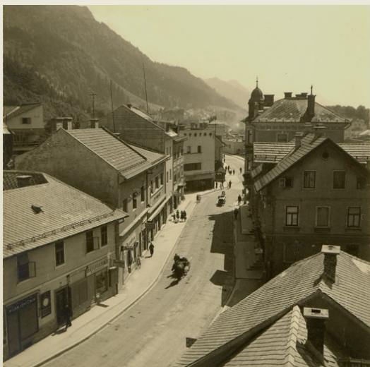
Gospodsvetska cesta, danes Cesta maršala Tita na Jesenicah, 1935–1939

Cesta maršala Tita velja za največkrat preimenovano ulico na Jesenicah. Današnje poimenovanje je dobila leta 1961, od 1930 do 1941 in od 1945 do 1961 se je imenovala Gospodsvetska cesta, v času 2. svetovne vojne pa Adolf Hitlerstrasse.