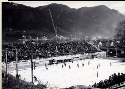
Svetovno hokejsko prvenstvo na Jesenicah leta 1966

Na Jesenicah so se razvijali trije športni centri: Španov vrh, Kres in Podmežakla. V Španovem vrhu so odprli prvo žičnico v državi. Žičniške naprave so bile tudi na Kresu in v Podmežakli. Tam so zaradi popularnosti hokeja postopoma dograjevali športno halo. Sprva je imelo drsališče eno tribuno, v naslednji fazi so postavili še drugo, čez čas streho in nazadnje obe stranski steni. Športna dvorana Podmežakla je leta 2013 gostila evropsko košarkarsko prvenstvo.