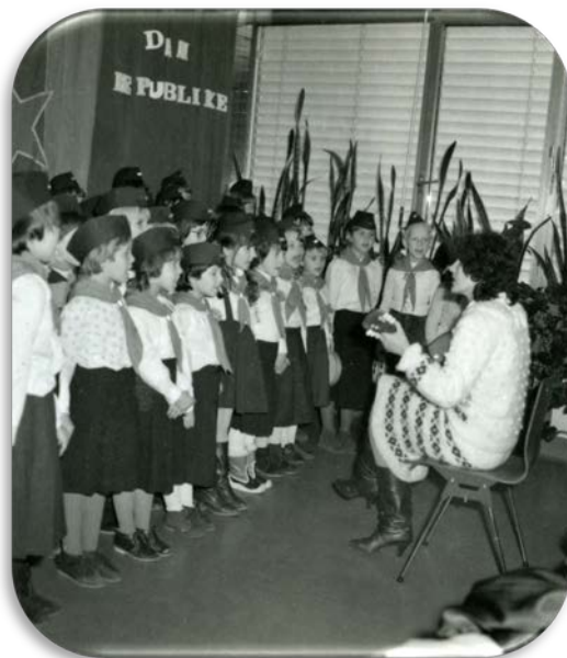
Vsak šolar je bil sprejet med Titove pionirje

Jugoslovanske trgovine so bile skromne s tehnično opremo in z živili. Ob koncu Jugoslavije je na Jesenicah prišlo do velikih ekonomskih sprememb. Na Koroški Beli so leta 1987 odprli novo jeklarno, na Jesenicah pa so staro jeklarno in plavže zaprli. 1. junija 1991 pa so odprli nov karavanški cestni predor.