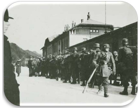
Prihod nemških vojakov na Jesenice, 11. 4. 1941

Partizani so začeli z gverilskimi napadi na sovražnikovo infrastrukturo. Uničevali so mostove, železniške proge in električno napeljavo za jeseniško železarno. Okupator je na napade odgovarjal z ukrepi proti civilnemu prebivalstvu. Največkrat s streljanjem talcev.