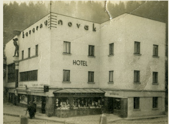
Hotel - kavarna Novak, 1933–1940

Eno- do dvonadstropna modernistična stavba pravokotnega tlorisa s kubusno zasnovo arhitekta Dragotina Faturja iz l. 1933 je bila velika pridobitev za mesto.