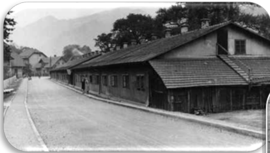
Stanovanjski baraki na Cesti 1. maja 1 in 2 na Jesenicah iz leta 1919 (foto: 1962, GMJ)

Eno- do dvonadstropna modernistična stavba pravokotnega tlorisa s kubusno zasnovo arhitekta Dragotina Faturja iz l. 1933 je bila velika pridobitev za mesto.