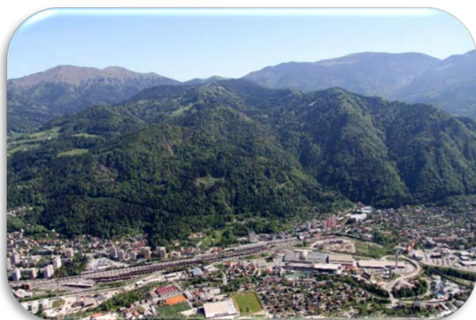
Panorama Jesenic z okolico z Mežakle