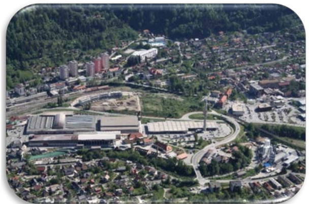
Panorama Jesenic z Mežakle

Staro Savo odlikuje bogata železarska tradicija. Tu so ohranjeni bistveni elementi nekdanjega fužinarskega naselja. Danes je območje namenjeno muzejski, kulturni in turistični dejavnosti.