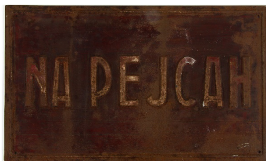
Ulična tabla Na Pejcah, 1930