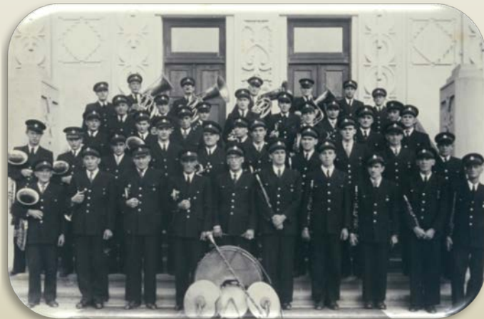
Sindikalna godba SKUD Kovinar I. 1950

Po drugi svetovni vojni so v jeseniški občini delovali številni pihalni orkestri, ki so se leta 1968 združili v Pihalni orkester jeseniških železarjev.