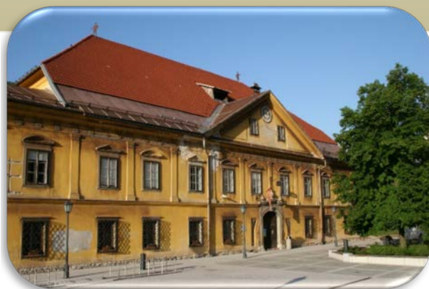
Gornjesavski muzej Jesenice ima sedež v Bucelleni-Ruardovi graščini na Stari Savi

Leta 1991 je Občina Jesenice ustanovila Muzej jesenice, ki je prevzel zbirke nekdanjega Tehniškega muzeja Železarne Jesenice in vzpostavil strokovno muzejsko delovanje. Leta 2000 se je preimenoval v Gornjesavski muzej Jesenice. Njegovo poslanstvo je skrb za prepoznavanje, ohranjanje, predstavljanje, razumevanje žive ter premične kulturne in naravne dediščine Gornjesavske doline ter železarske in planinske dediščine širšega slovenskega prostora.