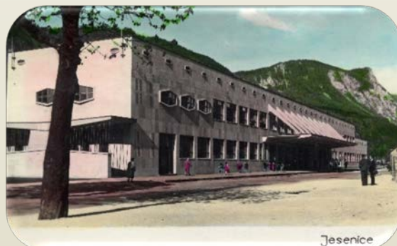
Kolodvor Jesenice

Z gradnjo arhitekturno zanimivih in modernih stavb so na Jesenicah nadaljevali tudi po 2. svetovni vojni. V tem obdobju velja omeniti predvsem jeseniški kolodvor arhitekta Stanislava Rohrmana iz leta 1955 in njegov prvi jeseniški povojni stanovanjski kompleks na Plavžu, ki je bil zgrajen med leti 1952–1960.