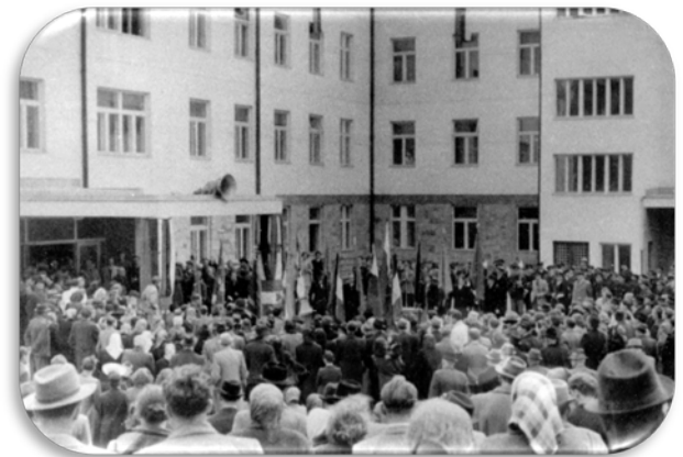
Odprtje Splošne bolnišnice Jesenice leta 1948 (fototeka GMI)

Leta 1957 so jeseniški hokejisti postali prvič državni prvaki. Na vrhu so se obdržali trinajst zaporednih sezon, potem pa so se vrsto let izmenjavali z ljubljansko Olimpijo. Med najboljšimi jeseniškimi hokejisti so bili fantje iz Kurje vasi. Stike z vrhom slovenskega športa so vzdrževali še smučarji, alpinisti, odbojkarji, košarkarji, igralci namiznega tenisa in šahisti.