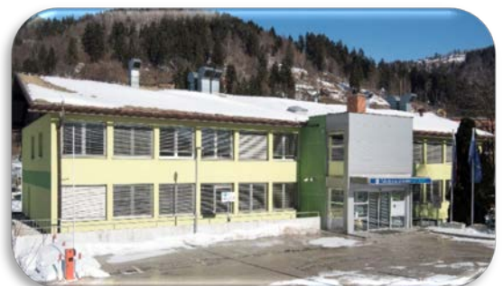
Fakulteta za zdravstvo Angele Boškin