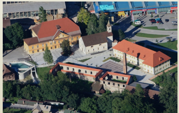
Stara Sava

Staro Savo odlikuje bogata železarska tradicija. Tu so ohranjeni bistveni elementi nekdanjega fužinarskega naselja. Danes je območje namenjeno muzejski, kulturni in turistični dejavnosti.