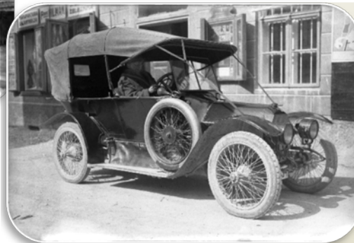
Eden prvih avtomobilov na Jesenicah, 1925–1935

Do vzpostavitve železniške povezave z Ljubljano, Trbižem, Trstom in Beljakom je po cestah potekal ves trgovski in potniški promet, in sicer peš, s konjsko ali volovsko vprego.