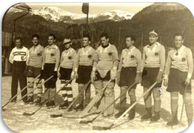
Medvojnje hokejsko moštvo

Kljub nasilju okupatorja šport med vojno ni povsem zamrl. V sezoni 1941/42 je bila odigrana tudi prva hokejska tekma jeseniškega moštva. Zaradi vojnih dogodkov se je moštvo razšlo.