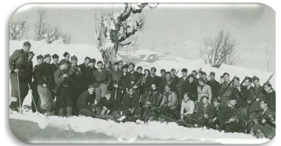
Partizanski borci II. bataljona in vodstvo Jeseniško-bohinjskega odreda, planina Vogar, januar 1945