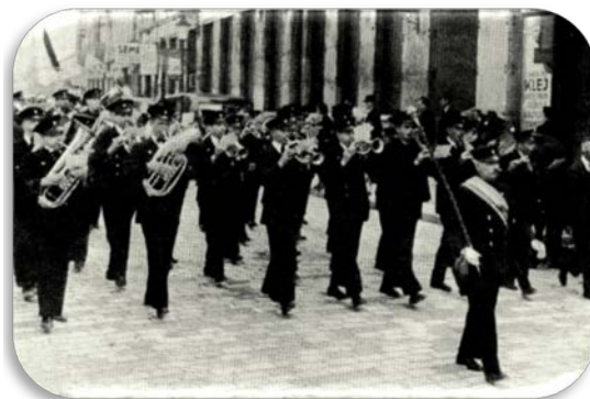
Krekova godba na sprejemu regenta Aleksandra I. v Ljubljani leta 1920

Takoj za godbenimi sestavi pa je bila tako po priljubljenosti kot pomembnosti gledališka dejavnost. V času med obema vojnoma so na Jesenicah delovali trije gledališki odri: sokolski, Krekov in delavski. Dramski odsek Krekovega društva poznamo tudi pod imenom katoliški oder. Na njem so igrali predvsem predstave s svetopisemsko vsebino, o katoliških praznikih in razne komedije. Sokolski oder pa je izvajal predvsem operete.