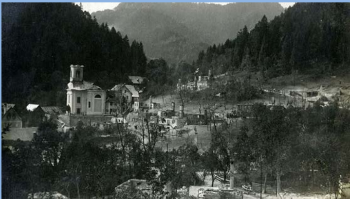
Koroška Bela po bombardiranju avgusta 1917

Ali ste vedeli: Med prvo svetovno vojno so italijanska letala bombardirala Koroško Belo. Pri tem sta umrli dve osebi.