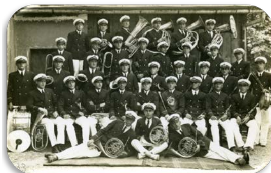
Kovinarska godba SMRJ ob praznovanju 1. maja 1936