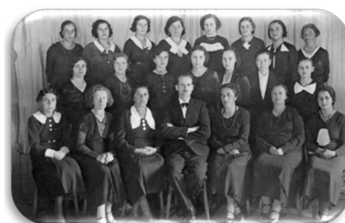
Ženski pevski zbor Svobode na Javorniku s pevovodjem, 7. 7. 1935

Jeseničani so svojo glasbeno poustvarjalnost izživel v številnih pevskih zborih. Na Jesenicah je prišlo do velike pevske prireditve 20. maja 1940, ko so v takratnem Sokolskem domu jeseniška pevska združenja priredila skupni pevski koncert. V tem času je na Jesenicah delovalo kar devet pevskih zborov.