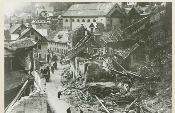
Gosposvetska ulica na Jesenicah, 1. 3. 1945

Anglo-ameriška letala so 1. 3. 1945 silovito napadla zelo pomembno jeseniško železniško križišče. Zaradi nemške protiletalske obrambe so morala bombe odvreči na veliki višini, zato niso padale samo na železnico, ampak tudi na številne okoliške hiše.