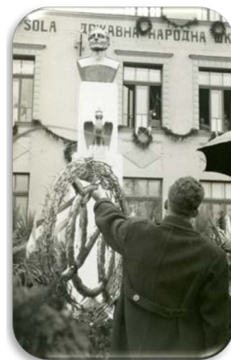
Kralju so pred Državno narodno šolo postavili doprsni kip

Iz seznama imen ulic iz tridesetih let 20. stoletja ugotovimo, da so se občinski uradniki pri poimenovanju ulic opirali predvsem na stara pokrajinska oziroma ledinska imena (Na Murovi, Na Plavžu, Na Pejcah ...) ali na gospodarsko oziroma obrtno dejavnost, ki se je vršila v določeni ulici (Obrtniška in Fužinska ulica, Industrijska cesta ...), ulice in ceste so poimenovali tudi po znamenitih in zavednih Slovincih (Aljaževa ulica, Prešernova cesta, Čopova cesta ...).