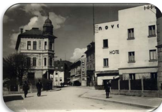
Gospovetska ulica, 1935–1940