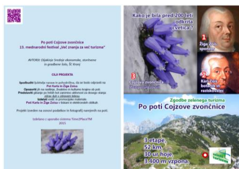
Slika 3: Naslovnica vodnika – Po poti Cojzove zvončnice

Več o vodniku Po poti Cojzove zvončnice si preberite na povezavi: https://goo.gl/OQAwgY