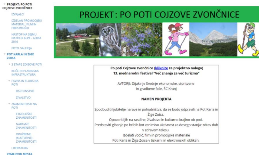
Slika 4: Spletna stran – Projekt: Po poti Cojzove zvončnice

Stran je mogoče tudi spremljati s pomočjo mobilnega telefona. V ta namen smo izdelali QR kodo, ki se nahaja tudi na spletni strani (Slika 4).