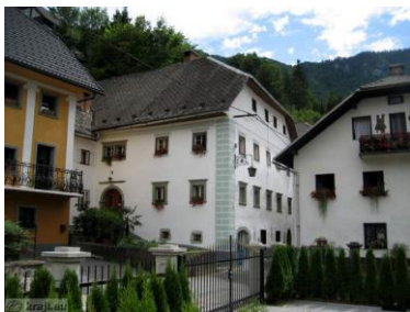
Slika 5: Foušaritnica

Fužinarski trg - Večina imenitnih hiš stoji ob osrednjem vaškem trgu – placu. Hiše v Kropi je oblikovala več stoletna kovaška tradicija. Vodna moč, potok »Kroparica«, ki izvira nad naseljem s stalnim Bučanjem ustvarja v Kropi posebno vzdušje. Ob njem se na obeh straneh ob breg doline stiskajo stare fužinarske hiše iz 17., 18., 19., stoletja. Fužinarske hiše so : velike hiše z majhnimi okni, portali so iz perachiškega tufa, kovano okrasje v obliki okenskih mrež, svetilk iz izveskov, poleti pa na oknih cvetijo rdečih naglih. Med hišami po svoji velikosti izstopajo Klinarjeva (v njej je kovaški muzej), Piberčeva, Potočnikova in Maclova (Slika 6).