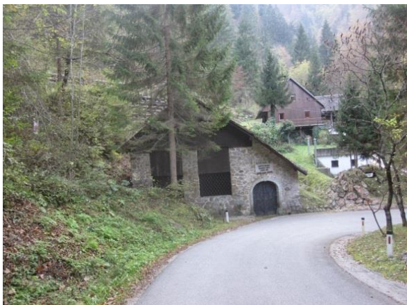
Slika 21: Slovenska peč