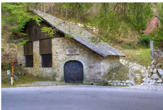
Slika 10: Slovenska Peč

Slovenska peč - V Dnu nad Kropo se nahaja Slovenska peč, talilnica železa iz 14. stoletja. Je najstarejša ohranjena talilna peč v Sloveniji in med najstarejšimi ohranjenimi v Evropi. Delovala je do sredine 15. stoletja. Ostanki objekta so zaščiteni z zidano stavbo tik ob cesti. Skozi veliki zamreženi okni je v notranjosti dobro vidna nekdanja peč (slika 11).