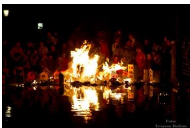
Slika 3: Barčice

Barčice - V Kropi otroci spuščajo barčice na Bajerju nekdanje spodnje fužine. Preprosta šega izvira iz časa ročnega kovanja. God sv. Gregorja je namreč do uvedbe gregorijanskega koledarja leta 1582 veljal za prvi pomladni dan. Pomlad, ki je pomenila daljši dan, več svetlobe in toplote, so pozdravili tudi kovači. Dan se je takrat že toliko podaljšal, da obrtniki pri svojem delu niso več potrebovali umetne razsvetljave. Luč so tako na predvečer Gregorjevega simbolično vrgli v vodo (slika 3).