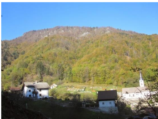
Slika 13: Pogled na cerkev sv. Lenarta

Med potjo imamo razgled na cerkev sv. Lenarta iz leta 1481 (Slika 13).