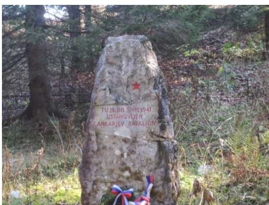
Slika 16: Spomenik Cankarjevega bataljona

Šli bomo po grebenski poti mimo Črnega vrha (najvišji vrh Jelovice, 1.307 m) in Zidane skale in se spustili do spomenika Cankarjevega bataljona (Slika 16).