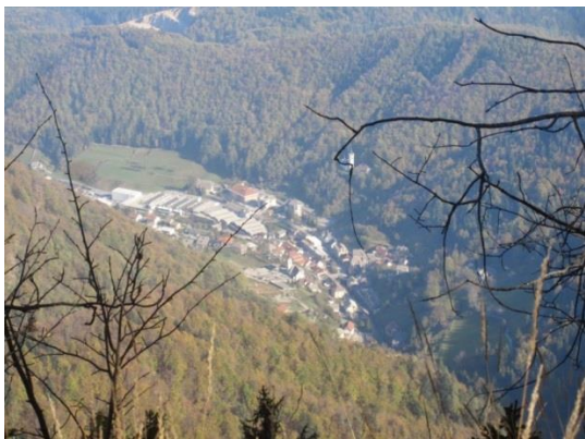
Slika 15: Pogled na Kropo

Šli bomo po grebenski poti mimo Črnega vrha (najvišji vrh Jelovice, 1.307 m) in Zidane skale in se spustili do spomenika Cankarjevega bataljona (Slika 16).