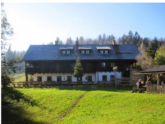
Slika 17: Koča na Vodiški planini

Sledi pot do Partizanskega doma na Vodiški planini (1118 m), kjer bomo naredili kratek postanek, da se odpočijemo (Slika 17).