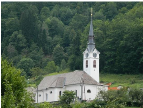
Slika 8: Cerkev Sv. Lenarta v Kropi

kapeli. Cerkev ima 5 oltarjev. V niši glavnega oltarja je kip sv. Leonarda, njegova slika iz leta 1874 pa je delo Henrike Langus. Oltarno sliko Marije Brezmadežne je leta 1895 naslikala najpomembnejša slovenska slikarka Ivana Kobilica (sliki 9, 10).