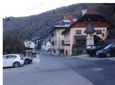
Slika 6: Fužinarski trg v Kropi

Potok Kroparica - Kroparica je potok, ki teče skozi naselje Kropa. Je povirni pritok potoka Lipnica, ki je prvi desni pritok reke Save po sotočju Save Bohinjke in Save Dolinke. Kroparica svoje vode nabira na severovzhodnih pobočjih planote Jelovica in je večkrat tudi hudourniškega značaja. Njen stalni pritok je Črni potok (slika 8).