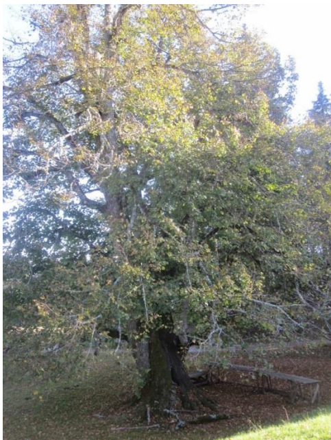
Slika 18: 530 let stara lipa na Vodiški planini

Po postanku se bomo spustili po bregovih Jelovice proti izvira Kroparice (Slika 19).