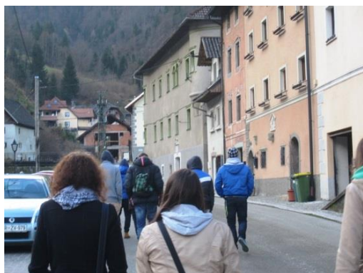
Slika 22: Turistični ogled Kroke

Sledil bo ogled Vigenc viceja, kjer nam bodo kovači predstavili izdelovanje žeblov. Vsak obiskovalec si bo lahko vzela kakšen žebelj za spomin. Iz Muzeja se bomo odpravili skozi kotel proti Slovenski peči in izviru Kroparice. Ko si bomo to ogledali, bomo odšli do cerkve Svetega Lenarta. Ogledali si bomo tudi njeno notranjost. Cena ogleda bo 11 €/osebo.