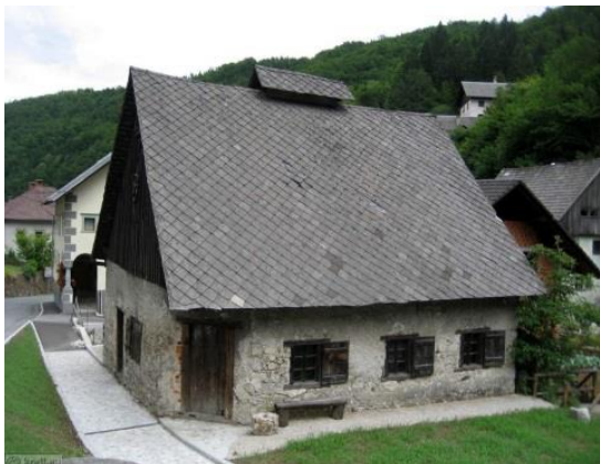
Slika 11: Vigenjc vice

so kovali še v prvi polovici 20. Stoletja. Leta 1479 je imela Kropa 8 vigenjcev. V vigenjcu Vice se je ohranila oprema iz 19. stoletja (Slike 12).