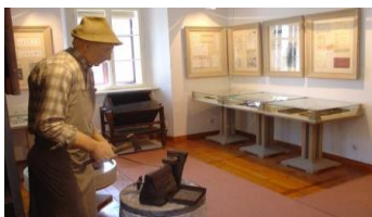
Slika 4: Kovaški muzej

Kovaški muzej - Muzej se nahaja v Klinarjevi hiši, ki je tipična fužinarska stavba s konca 18. stoletja. V prvem nadstropju so predstavljene osnove železarstva v Kropi, Kamni Gorici in Kolnici. Z maketami je prikazano delovanje fužine in kovaških mehov na vodi ter tipična kovačnica za izdelavo žebeljev – vigenj. V drugem nadstropju je etnološka soba z prikazom vsakdanjega in prazničnega življenja kroparskih kovačev ter zbirka 94 ročno kovanih žebeljev različne velikosti in oblik. Muzej je prvi tehniški muzej na slovenskem, ki je bil odprt za javnost že leta 1952. Predstavlja tehnično-zgodovinski razvoj obdelave železa, gospodarske, socialne, demografske in kulturne razmere v Kropi (Slika 4).