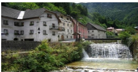
Slika 7: Kroparica

Potok Kroparica - Kroparica je potok, ki teče skozi naselje Kropa. Je povirni pritok potoka Lipnica, ki je prvi desni pritok reke Save po sotočju Save Bohinjke in Save Dolinke. Kroparica svoje vode nabira na severovzhodnih pobočjih planote Jelovica in je večkrat tudi hudourniškega značaja. Njen stalni pritok je Črni potok (slika 8).