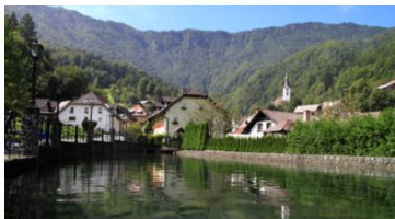
Slika 2: Bajar

Voda je bila na ta način v dobi kovaštva speljana do vodnih koles, ki so stala ob fužinah, cajnaricah in vigenjcih. Za vigenjcem Vice in pred delavnico Uko se v vodni raki še vedno vrti leseno kolo. Ohranjen sistem vodnih rak z zapornicami in bajerjem priča o pomenu in uporabi vodne moči za proizvodnjo energije, potrebne za kovanje (slika 2).