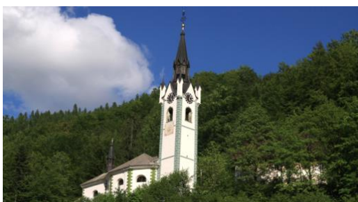
Slika 9: Cerkev svete Matere božje v Kropi

Cerkev Sv. Matere božje v Kropi - Podružnična cerkev Matere božje je med domačini bolj poznana kot Pri kapelci ali Kapelca. Graditi so jo začeli leta 1712 nad naseljem na mestu, kjer je sedem dečkov leta 1707 našlo Marijino milostno podobico – Kroparsko Mater božjo. Tloris cerkve je potegnjena osemkotnik s kvadratnim prezbitერიem. Cerkev je primer baročne arhitekture. Zvonik so povišali sredi 19. stoletja in je visok kar 56 metrov. Oblikovno izstopa njegova novogotska streha. Kroparji so si 2. julija vzeli svoj praznik in zgradili cerkev svete Matere. Ta dan je bil nezapovedan praznik, pomemben pa kot Božič in Velika noč ker so delali 6 dni na teden 12-16 ur na dan (slika 10).