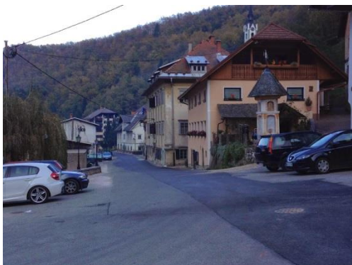
Slika 12: Začetek pohoda na Fužinarskem trgu v Kropi

Pot se začne na osrednjem vaškem trgu »placu«, nato pot nadaljujemo po gozdni poti (Slika 12).