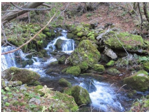
Slika 19: Izvir Kroparice

Po postanku se bomo spustili po bregovih Jelovice proti izvira Kroparice (Slika 19).