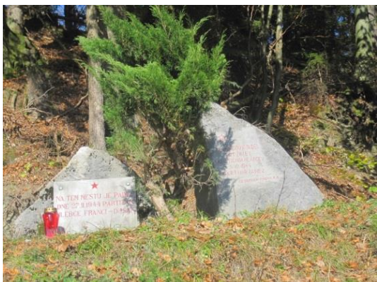
Slika 14: Spomenik padlim borcem NOB na Jamniku

Pot nadaljujemo proti vasi Jamnik. V bližini Jamnika pridemo na asfaltirano cesto, gremo tudi mimo spomenika padlim borcem NOB (Slika 16). Tu bomo opazili tudi cerkev sv. Primoža in Felicijana na Jamniku.