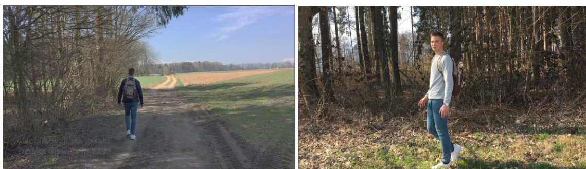
Slika 5: Vodeni ogled na terasi Nacovke

Dne 12. 3. 2020 smo se sodelujoči v projektu: Festival Udin boršt 2020 zbrali v Strahinju, pred gostilno Bovavc. To sva bila mentor Janez Černilec in projektni sodelavec Luka Zadnikar. Klara Slatnar je bila odsotna zaradi bolezni. Odpravila sva se proti severozahodu Strahinja, kjer se nahaja terasa Nacovka, ki se nekaj deset metrov dviguje nad ravnino. V načrtu sva imela, da prehodiva Nacovko po njenih obronkih. Ko sva hodila po načrtani poti, po kateri naju je vodila GPS sled mobilnega telefona, sva prišla najprej do smreke. Luka Zadnikar je povedal nekaj botaničnih, uporabnih, mitoloških ... stvari o tem drevesu. Na tak način so bila predstavljena še ostala drevesa, ki smo jih imeli v načrtu za ogled (točka 2.3). Nekaj stvari pa je bilo povedanih tudi o rimski villi rustici, ki je bila odkrita na Nacovki, o sami nacovki, mejnici ... Za ogled sva potrebovala okoli 2 uri (Slika 5).