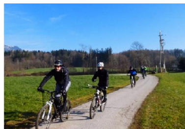
KOLESARJI NA GORSKIH KOLESIH