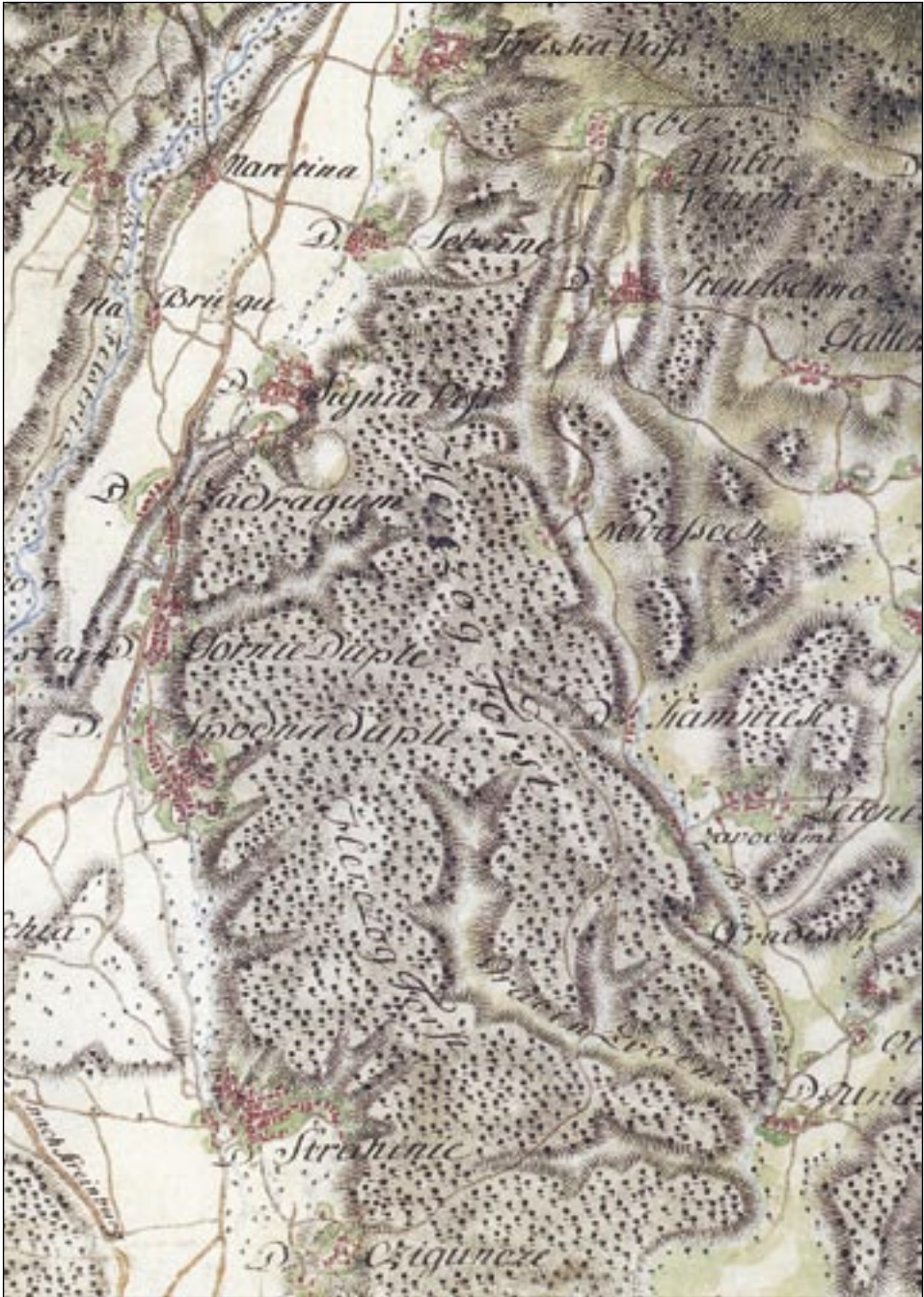
Slika 2: Udin boršt na vojaški karti iz konca 18. stoletja (Rajšp 1998).