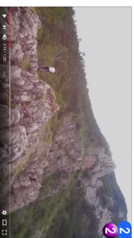
2 2 Oborak • NASTAVITE DALJE OBRONKOM, I DALJE JE USPON, A ZATIM ULAZITE U NOVU SUMU. U POČETKU JE LAGANA SETNJA, A ONDA OPET JAK USPON I TAKO NEKO VREME.