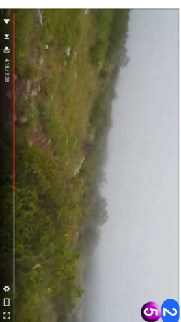
2 5 Sa vrha prema selu Rtanj • KRENULI SMO NA DOLE JUŽNOM STRANOM, MALO SERPENTINAMA A MALO VERTIKALNO NADOLE. STO DOLAZI U OBZIR SAAMO UZ VELIKU OBAZIRIVOST. STAZA JE U OVOM DELU GOTOVO POTPUNO GOLA, A POSLE ODVAJANJA PUTEVA (ONAJ DRUGI VODI KA SOKOBANJU), ULAZI SE