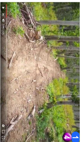
1 4 Koški put i divje maline • UBRZO SE IZLAZI NA KOŠKI PUT GDE SMO NASLI NA DIVLJE MALINE, MLJAC.