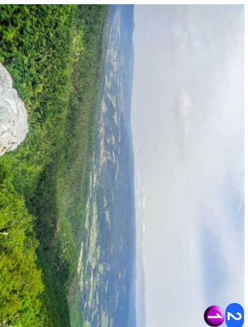
2 1 Sa vrha prema selu Rtanj • KRENULI SMO NA DOLE JUŽNOM STRANOM, MALO SERPENTINAMA A MALO VERTIKALNO NADOLE. STO DOLAZI U OBZIR SAAMO UZ VELIKU OBAZIRIVOST. STAZA JE U OVOM DELU GOTOVO POTPUNO GOLA, A POSLE ODVAJANJA PUTEVA (ONAJ DRUGI VODI KA SOKOBANJU), ULAZI SE