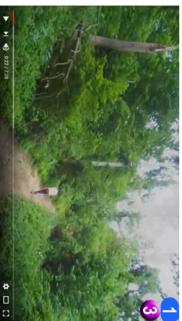
1 3 Prve markacije • PUT SE UBRZO SUZAVA, ALI KRECU I PRVE MARKACIJE U SUMI, SUMA JE NARAVNO IZUZETNO ATRAKTIVNA, KAO UOSTALO I CEO RTANJ.