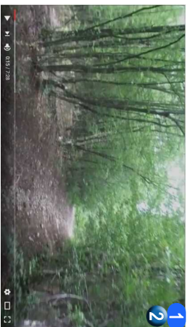
1 2 Početak puta • PENJEMO TEZOM SEVERNOM, A SILAŽIMO RELATIVNO LAKSOM JUŽNOM.