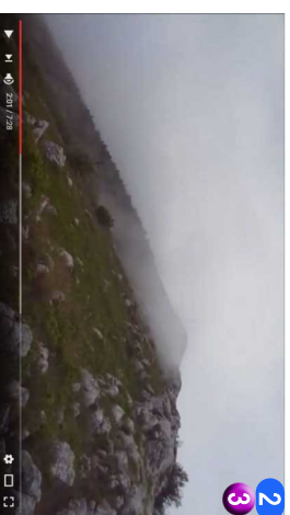
2 3 Greben • KADA IZBIJETE NALIVADU, DO SAMOG VRHA VAS VIŠE NISTANE STITI OD SUNCA ILI VETRA. MI SUNCE NISMO IMALI, ALI VETAR JE BIO JAKO SNAŽAN, A ZADESILA NAS JE I VRLO GUSTA MAGLA. POSLEDNJIH 2-3 KM PUTA I 300-400 M VIŠINSKE RAZLIKE IDE SE PO GREBENU, MADA SAM JA SKONTO DA JE MALO LAKSE ICI ISPOD I IZBITI NA JUŽNI PRILAZ ZBOG PRISUSTVA SERPENTINA KOJE UMNOGO ME "ODMARAJU" NOGE.