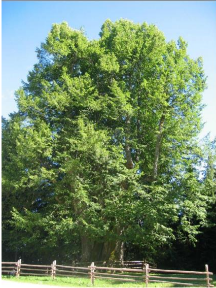
Slika 2: Najevska lipa (Najvenikov lipovec)