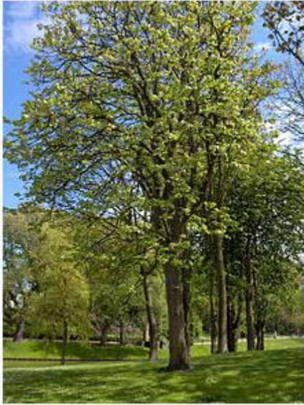
Slika 8: Navadna lipa ( Tilia platyphyllos )

Tilia cordata ali lipovec, imenovan tudi: