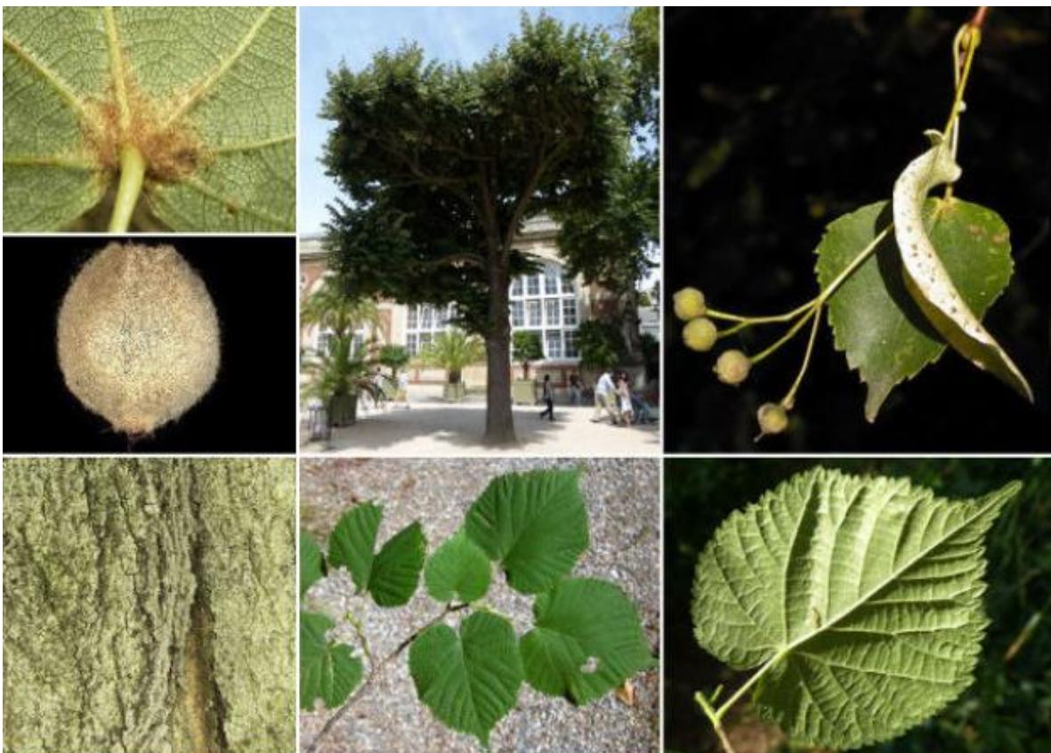
Slika 11: Lipovec ( Tilia cordata )

Lipovec ( Tilia cordata ) je do 30 metrov visoko listopadno drevo. a njegovem kratkem deblu se razvije široka krošnja. V gozdnih sestojih je deбло višje, krošnja pa ožja. Črnkasto sivo lubje je vzdolžno izbrazdano. Mladi poganjki so običajno brez dlak. Listi so skoraj okrogli in koničasto priostreni, dno listne ploskve pa je srčasto. Listni rob je drobno do grobo nazobčan, listni pecelj pa je gol. Od 3 do 10 rumenkastih cvetov je združenih v kobilasta socvetja, ki visijo z vej. Na bazi je vsako socvetje zraslo z ozkim podpornim listom. Plodovi so majhni kroglasti oreški, ki jih s prsti z lahko stisnemo (Slika 11).