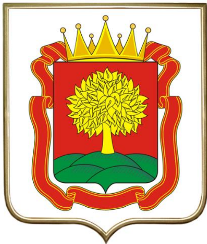
Slika 4: Grb ruskega mesta Lipeck

Mnoga slovaška, ukrajinska in ruska mesta imajo v svojem grbu upodobljeno lipo kot na primer rusko mesto Lipeck: zelena barva simbolizira zemljo in plodnost, rdeča barva simbolizira zmago pogumnih vojščakov v boju proti Tatarom in Mongolom, pet gričev pa pokrajine, ki so združene v Lipecki guberniji (Slika 4).