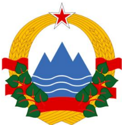
Slika 5: Grb Socialistične republike Slovenije

Monetarna valuta slovenska lipo, katere idejni vodja je bil Bogdan Oblak - Hamurabi, je bila neuradna slovenska valuta. Pripravljala se je izdaja bankovcev v več vrednostih, vendar je do natisa spomladi leta 1990 prišel le bankovec za eno lipo. Slovenska politika ni bila naklonjena ideji o lipi kot nacionalni valuti, medtem ko je leta 1994 Svet Narodne banke Hrvaške sprejel odločitev o uvedbi novih bankovcev in kovancev, ki so jih poimenovali kuna in lipo (Slika 6).