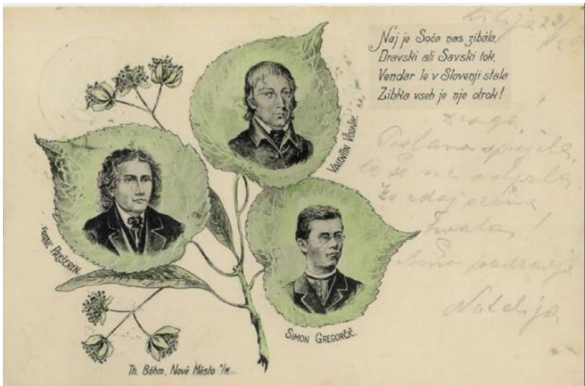
Slika 12: Prve Prešernove razglednice