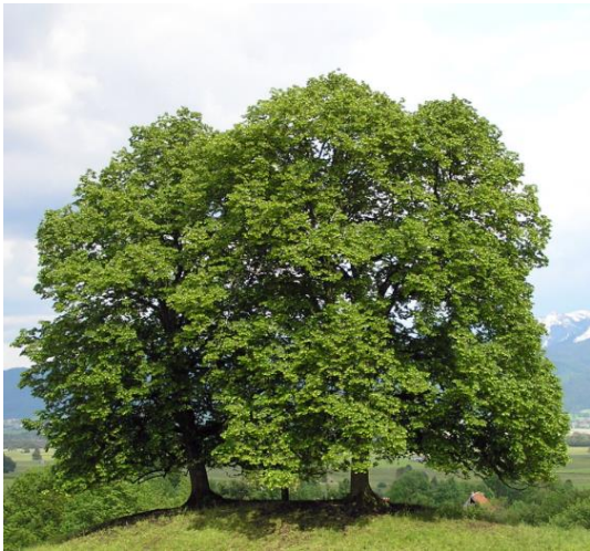
Slika 9: Lipovec ( Tilia platyphyllos )