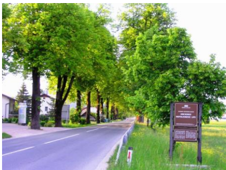
Slika 3: Napoleonov lipov drevored v Logatcu