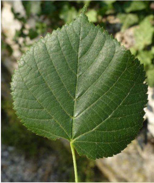
Slika 10: List navadne lipe

Lipovec ( Tilia cordata ) je do 30 metrov visoko listopadno drevo. a njegovem kratkem deblu se razvije široka krošnja. V gozdnih sestojih je deбло višje, krošnja pa ožja. Črnkasto sivo lubje je vzdolžno izbrazdano. Mladi poganjki so običajno brez dlak. Listi so skoraj okrogli in koničasto priostreni, dno listne ploskve pa je srčasto. Listni rob je drobno do grobo nazobčan, listni pecelj pa je gol. Od 3 do 10 rumenkastih cvetov je združenih v kobilasta socvetja, ki visijo z vej. Na bazi je vsako socvetje zraslo z ozkim podpornim listom. Plodovi so majhni kroglasti oreški, ki jih s prsti z lahko stisnemo (Slika 11).