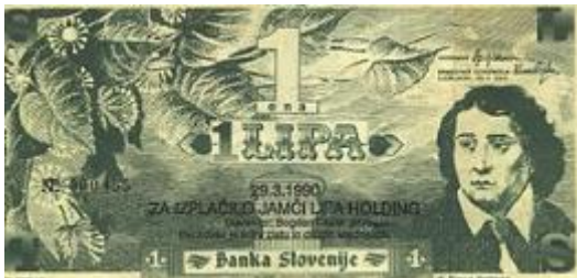
Slika 6: 1 Prednja stran bankovca za 1 lipo

Monetarna valuta slovenska lipo, katere idejni vodja je bil Bogdan Oblak - Hamurabi, je bila neuradna slovenska valuta. Pripravljala se je izdaja bankovcev v več vrednostih, vendar je do natisa spomladi leta 1990 prišel le bankovec za eno lipo. Slovenska politika ni bila naklonjena ideji o lipi kot nacionalni valuti, medtem ko je leta 1994 Svet Narodne banke Hrvaške sprejel odločitev o uvedbi novih bankovcev in kovancev, ki so jih poimenovali kuna in lipo (Slika 6).