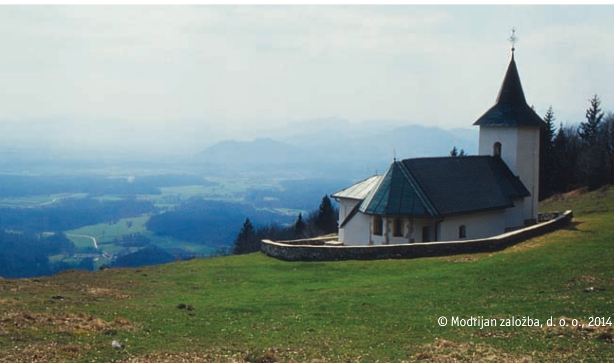
S sv. Lovrenca se ponuja širni razgled po gorenjski ravnici okoli Kranja.

Razgledna planjava pred planinsko kočjo, ki stoji tik ob cerkvi, zna biti v duhu tega stoletja razigrana in glasna od izletnikov. Samo enkrat se živi! Usoda ima en sam preizkus, že prvič se mora posrečiti! Narava nam pri tem pomaga! Zmiraj krasna je narava , je stih Josipine Turnograjske (1831–1852), ki živela pod Jakobom v gradu Turn, visoko nadarjene umetnice, ki je umrla, ko je prvič rojevala. Zdaj je Krištof kvečjemu kak krepek možakar, ki prinese svojega otroka na ramenih sem na visoko. Vsi vemo, kako je z nošnjo otrok. Treba jih je nositi tudi daleč, lahke ali težke, daleč v njihovo življenje, s plačilom ali brez, zmeraj pa z upanjem.