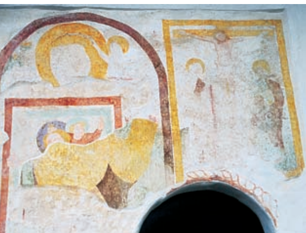
Sv. Krištof na južni steni cerkvice sv. Miklavža, znamenita freska neznanega »Maškega mojstra«

skozi zaklenjena rešetkasta vrata k ostankom slabše ohranjenih gotskih fresk iz srede 15. stoletja. Z leve strani slavoločnega loka pred rebrasto obočnim oltarnim prostorom nam svoja pogleda iz jaslic vračata dva oslička, polna božične spokojnosti. Sv. Jakob pa opreza iz baročnega oltarčka, ali je prišel kakšen vojak, delavec, lekarnar ali kakšen Španec, ki jim je zavetnik. Dolg je seznam zavetništev tega ljudskega svetnika; še zoper revmo je dober. Kdor pa roma k njemu v Kompostelje in prehodi vseh 800 kilometrov Jakobove poti po Španiji, morda zavetnika sploh ne potrebuje, ker poka od zdravja in zadovoljstva nad samim seboj. Krištofa na zunanji steni cerkve ni več videti s prostim očesom. Morda nam je s tem nekaj sporočeno, nekaj o tem, da se na srečno usodo ne gre zanašati niti en dan.