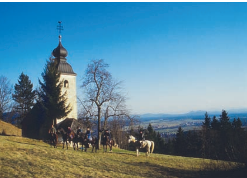
Sv. Miklavža nad Mačami občasno obiskujejo tudi konjeniki s posestva Brdo.