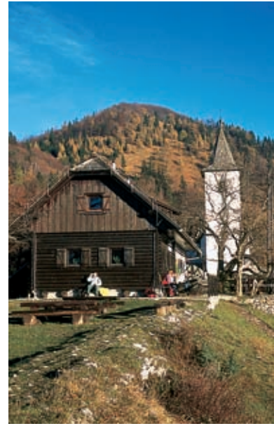
Planinska kočica pred cerkvico sv. Jakoba nad Preddvorom

Zadnjemu od podstoržičskih svetih trojčkov, Jakobu, delata družbo kar dva planinska doma, vendar noben planinec ne reče, da gre k njima: namreč k Iskrini koči ali k Franciju. Vsak reče, da gre na Jakoba, k tisti beli cerkvi, ki se iz doline tako jasno, tako vabljivo odraža od gorskega ozadja s Hudičevim borštom. Verjetno tudi ni planinca, ki bi ga k njemu gnalo samo zaradi umetnosti. Tu in tam kdo pokuka