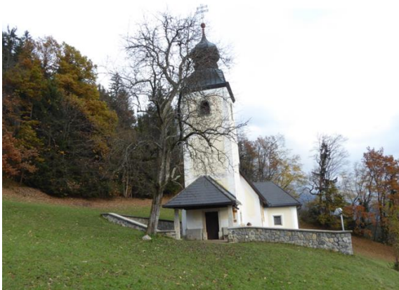
Slika 2: Cerkev sv. Miklavža (Nikolaja) nad Mačami

Cerkev sv. Miklavža je bila zgrajena leta 1467 in leta 1649 je bila baročno prezidana (Slika 2). V času turških upadov je cerkev sv. Miklavža služila kot skrivališče pred Turki, pri čemer je bila škarpa višja kot sedaj. Nova škarpa je bila narejena pred 7 leti.