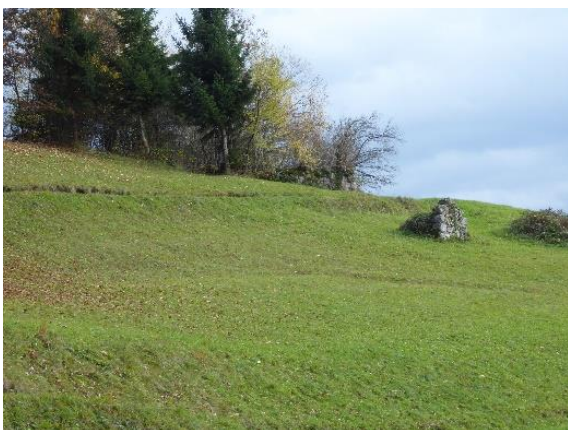
Slika 3: Ruševine nekdanje mežnarije poleg cerkve sv. Miklavža nad Mačami

Na jasi, na zahodni strani cerkve je bila nekoč mežnarija, hlev ..., a od nje so ostale samo ruševine. Mežnarija je pod cerkvijo imela njivo. Nekoliko stran od mežnarije je bila še kajža, ki pa jo tudi ni več. V mežnariji je živel bašeljski mežnar. Njegovo delo je bilo, da zvoni zjutraj ob 7. uri, pa opoldne in zvečer Ave Marijo. Da se je preživljal, je pobiral bero po vaseh (Slika 3).