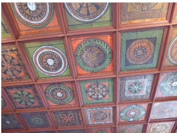
Slika 5: Lesen kasetiran strop v cerkvi sv. Miklavža