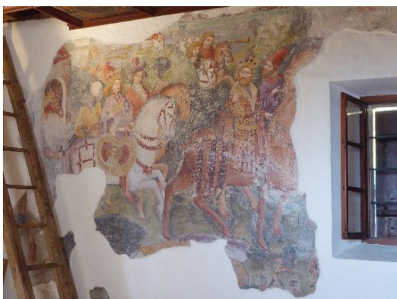
Slika 6: Freska pohod Svetih Treh kraljev

Na freski Poklon Svetih Treh kraljev (Slika 7), ki je edina freska na Slovenskem, kjer se Jožef zanima za obiskovalce, ki so Sveti Trije kralji in se jim je poklonil. Na drugih slikah s tem motivom Jožef vedno nekaj dela in se ne zanima za njih. Na freski so obrazi do potankosti izdelani, izredno lepi in mehki. Na freski sta zelo dobro ohranjena Marija in Jezus. Ostale podobe pa je že nekoliko načel zob časa. Oblačila oseb na sliki so z lepimi baročnimi vzorci. Posebej so poudarjeni pasovi, bordure in ostale obrobe. Slike imajo 3 D videz. Npr. krone so nekoliko poglobljene, izbočene ipd. Za osebami je mesto Betlehem kot so si ga predstavljali v tistem času. Štalca, kjer sta prenočila Marija in Jožef in se je rodil Jezus Kristus, je gorenjskega videza in ne ustreza betlehenskemu okolje.