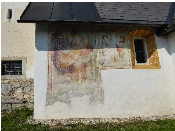
Slika 4: Freska sv. Krištofa na južni strani cerkve sv. Miklavža in Jezusovo križanje

Poleg podobe sv. Krištofa je freska, ki prikazuje križanje Jezusa Kristusa, pod križem pa stojita sv. Marija in sv. Janez. Freske so bile naslikane na svež omet, zato so zelo obstojne (Slika 4).