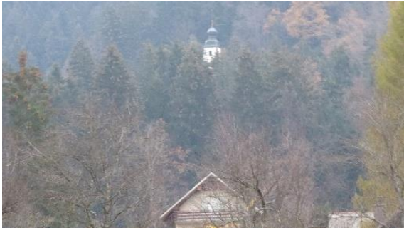
Slika 1: Pogled na cerkev sv. Miklavža iz Mač

Cerkev sv. Miklavža (sv. Nikolaja) se zdi na prvi pogled le nekaj minut oddaljena od Mač, le skozi smrekov gozdič, se zdi, je treba stopiti, vendar se bo marsikateri popotnik tudi do Miklavža upehal in prepotil (Slika 1).