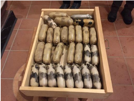
Slika 10: Prašički, ki služijo obredu, ki je vsako leto po 17. januarju

V cerkvi sv. Miklavža je vsako leto po 17. januarju maša. Pri maši se zbere do 500 ljudi. Med mašo je tudi razprodaja mesnih izdelkov z licitacijo. Nekoč je licitiranje potekalo v cerkvi, zadnja leta pa je zunaj. Pri maši poteka še en obred: na stolu t.i. štokrlu so v zaboju prašički. Le-tega obiskovalci maše vzamejo iz zaboja in ga nesejo okoli oltarja. Pri tem obhodu darujejo nekaj denarja za cerkev in odložijo prašička nazaj v zaboj (Slika 10).