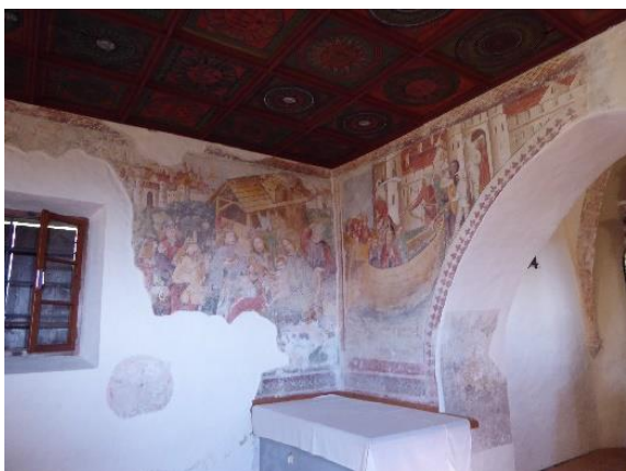
Slika 7: Gotska freska poklon svetih treh kraljev in freska sv. Uršule