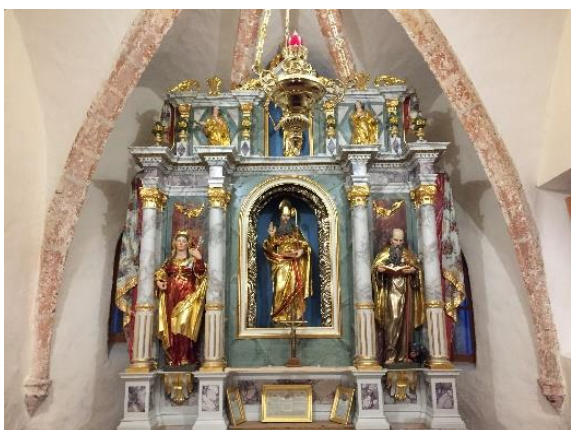
Slika 9: Glavni oltar v cerkvi sv. Miklavža nad Mačami

Glavni oltar je bil obnovljen približno pred 14 leti. V sredini oltarja je sv. Miklavž, desno pa sv. Anton puščavnik s prašičkom, ki je zavetnik živinorejcev in levo je sv. Uršula (Slika 9).