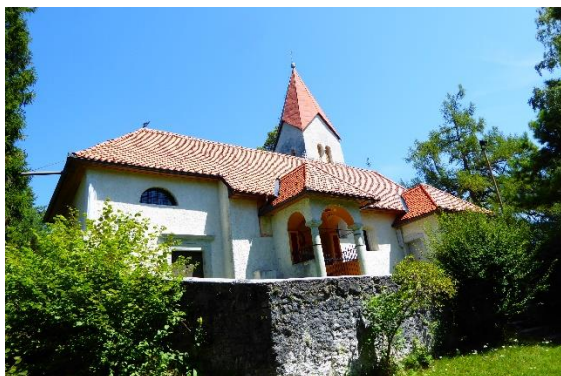
Slika 2: Cerkev sv. Jurija, Bistrica pri Tržiču

Enoladijska, še v celoti srednjeveška ravno krita gotska cerkev z zvezdasto obokanim prezbiterijem je nastala najverjetneje na začetku 16. stoletja, čeprav se že leta 1444 posredno omenja na tem mestu neka cerkvena arhitektura. Prej lesena lopa je bila v začetku 18. stoletja pozidana in vključena v cerkveno jedro.