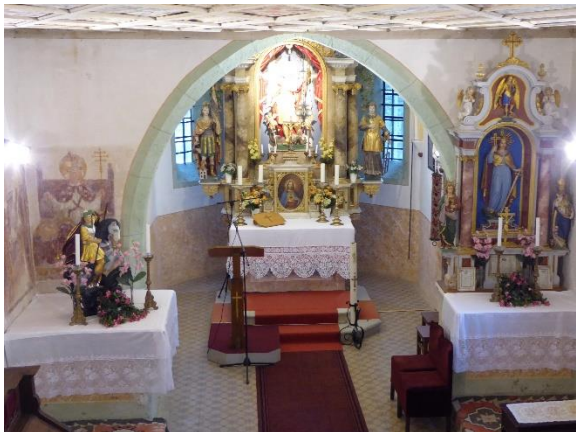
Slika 4: Notranjost cerkve sv. Jurija