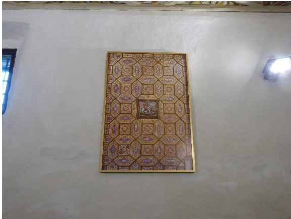
Slika 3: Pozno renesančni poslikan lesen strop, prenesen v cerkev sv. Jožefa v Trziču

Cerkev je imela tudi lep pozno renesančni poslikan lesen strop iz leta 1698, ki je bil prenesen v podružnično cerkev sv. Jožefa v Trziču. Strop sestavljajo osmerokotniki, v katerih so manjša kvadratna polja z bogato floralno oziroma ornamentalno poslikavo, na sredini stropa pa dominira podoba sv. Jurija v boju z zmajem. Oprema 19. stol (slika 3).