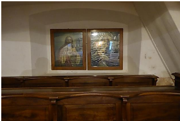
Slika 6: Kor, cerkev sv. Jurija, Bistrica pri Trziču

Cerkev je opremljena z lesenim klopmi, prav tako pa na vseh zidovih stojijo slike. Oltar je pozlačen in lesen z okraski, ki so prispodobni za tisto leto. Zvon so zgradili kasneje (slika 6).