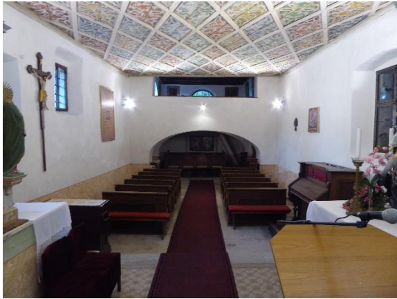
Slika 5: Strop v cerkvi sv. Jurija

Na šilastem slavlolu in prezbiteriju je delno ohranjena poslikava Jerneja iz Loke iz začetka 16. stoletja." Na slavoločni steni izstopa dominantna podoba sv. Urbana, ki kot papež, sedi na prestolu, ter drži v levici papeški križ in v desnici grozd. V isto časovno obdobje sodi lepo ohranjen na romboidna polja razdeljen lesen strop, kije poslikan z motivom krogovičevja na rdeči, zeleni, rumeni in modri podlagi (slika 5).