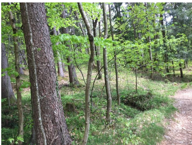
Slika 5: Ko prečimo makadamsko gozdno cesto, se začnemo vzpenjati proti cerkvi sv. Miklavža

Dokaj strma gozdna steza nas popelje mimo mogočnih dreves do jase. Tu se pot še vedno strmo dviguje po travnikih vse do cerkve.