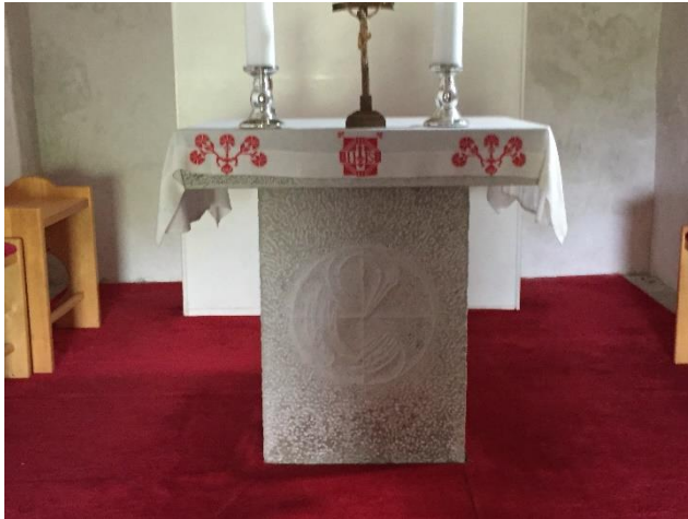
Slika 3: Daritveni oltar v cerkvi Sv. Marjete na Šmarjetni gori z vklesano Marijo

Cerkev sv. Marjete je dopolnilo hotelu Bellevue, kajti v njej potekajo poroke. Slavje pa se nadaljuje v gostinskem obratu. Aktualna cerkev sv. Marjete je bila zgrajena na ruševinah starodavne cerkve v 80. letih 20. stoletja. Notrajnost je opremljena s kipcema Sv. Magdalene oziroma Sv. Marije, ki sta v družbi Jezusa. Na stenah visi tudi modern Križev pot. Na stenah prezbiterija pa se nahaja moderna cerkvena slika. Zanimiv pa je tudi daritveni lotar, ki ima na sprednjem delu marmorja vklesano sv. Marijo (Slika 3).