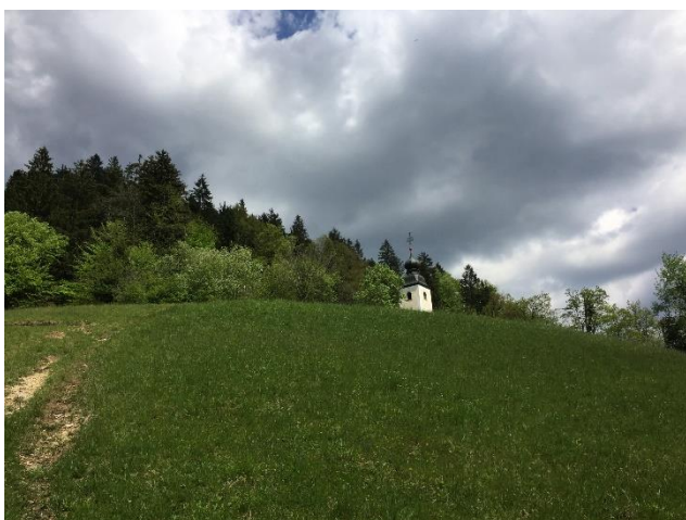
Slika 6: V bližini cerkve sv. Miklavža nad Mačami

Dokaj strma gozdna steza nas popelje mimo mogočnih dreves do jase. Tu se pot še vedno strmo dviguje po travnikih vse do cerkve.