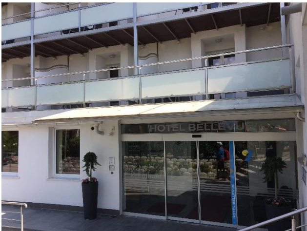
Slika 2: Hotel Bellevue na vrhu Šmarjetne gore

Najbolj v oči »bode« hotel Bellevue na vrhu hriba. Ko po 10 minuta hoje zapustimo asfaltno cesto, ki nas ne sme potegniti do bližnjih hiš, kjer se cesta zaključi z ograjo, se še 15 minut strmo vzpenjamo do asfaltne ceste, ki privijuga iz severovzhodnega dela Stražišča in je edina cesta za avtomobile na Šmarjetno goro. Od tu rabimo še 10 minut strmega vzpenjanja po makadamski cesti do vrha Šmarjetne gore, ki poteka po južnem delu hriba. Na vrhu se lahko okrepčamo, prespimo ... v hotelu Bellevue. Tu vedno lahko srečamo številne obiskovalce že večkrat omenjenega hriba. Lahko pa v recepciji vzamemo tudi ključ od cerkvenih vrat cerkve Sv. Marjete. V zameno za ključ osebju izročimo osebni dokument, da bi ključ uspešno vrnili v recepcijo.