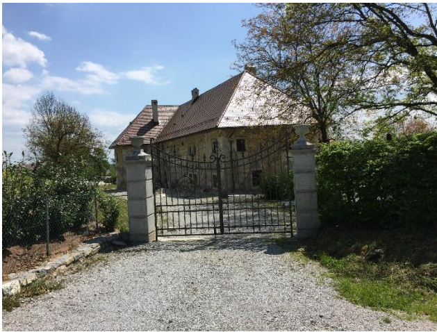
Slika 1: Stražiški grad pod Šmarjetno goro

Za prvomajske praznike sva z Mihom na prehodila odsek poti: Gorenjske hribovske cerkve na relaciji: Stražišče – Šmarjetna gora. Pot poteka najprej po asfaltu skozi naselje Stražišče, dokler ne pridemo do območja Pod gradom (Slika 1), kjer se asfaltna pot začne dvigovati proti Šmarjetni gori, ki jo na tem mestu lahko ozremo že iz dokajšnje bližine.