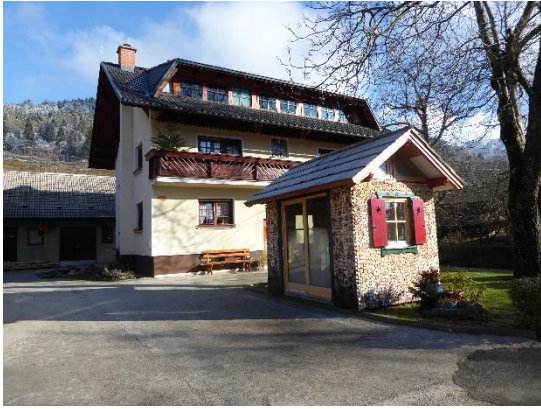
Slika 10: Zgornja Štefanja vas