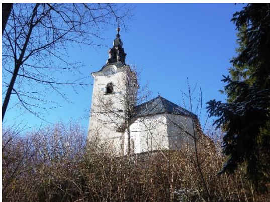
Slika 6: Zvonik cerkve sv. Štefana na Štefanji Gori

Zvonik na južni strani prezbiterija gosti tri bronaste zvonove. Mali, je preživel državno ropanje v prvi svetovni vojni, je tretji najstarejši v občini. Ulil ga je ljubljanski zvonar Joseph Samassa davnega leta 1736. Tehta cca. 250 kg, premer v je 77 cm, uglašen je na ton c1. Tudi veliki zvon je bil iz leta 1740, a žal prve svetovne vojne ni preživel. Poznavalec zvonov na Gorenjskem Jožef Lavtižar je zapisal, da so bili stari štefanjski zvonovi zelo dobro ubrani. Po prvi svetovni vojni so medvojno izgubo nadomestili: leta 1922 so kupili srednji zvon s 335 kg, leta 1925 pa še velikega s težo 529 kg. Nanje so dali upodobiti vse svetnike, ki jih časte v štefanjski cerkvi: na srednjega sv. Lavrencija, sv. Jedert in sv. Vincencija, na velikega sv. Štefana, Sv. Florijana in še farno zavetnico Vnebovzeto (Slika 6).