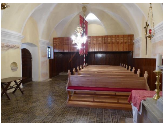
Slika 2: Notranjost cerkve sv. Štefana

Stene pravilno tristrano sklenjenega prezbiterija, ki je verjetno ostanek neke starejše stavbe, so členjene z ozkimi lomljenimi pilastri v vseh vogalih. Nad njimi so deli venčnega zidca, ki je skromnejši kakor v ladji. Pokriva ga kupoli podoben obok, kjer se od šestih vogalnih pilastrov dvigajo klinasti pasovi proti temenu z baročnim okvirom iz štuka.