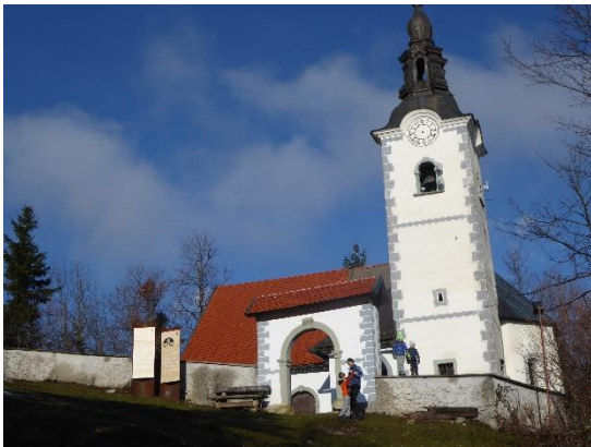
Slika 1: Cerkev sv. Štefana na Štefanji Gori