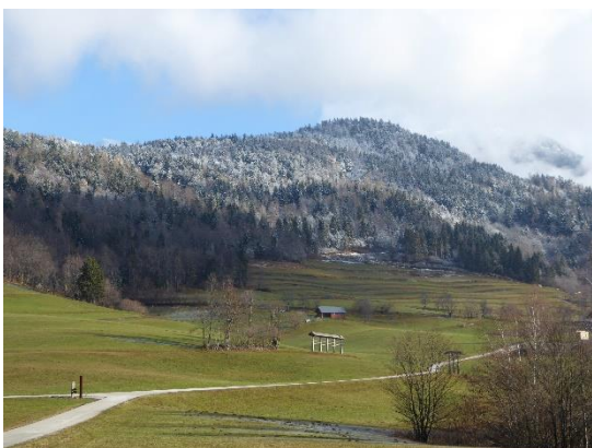
Slika 9: Okolica zgornje Štefanje vasi