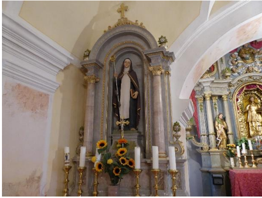
Slika 4: Levi stranski oltar posvečen sv. Jedrti