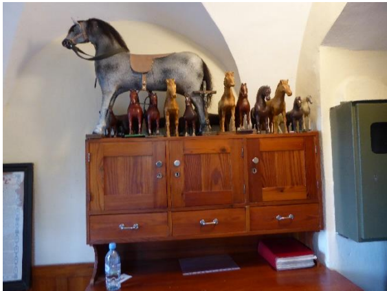
Slika 7: Konjski kipci, ki ponazarjajo število konj v hlevu lastnika

Sv. Štefanu so se in se še priporočajo rejci konj. Ker sta konjereja in trgovina s konji v cerkljanski fari nekdanj zelo cveteli, je imel sv. Štefan vedno dovolj častilcev. Ob tem se je razvil običaj, da gospodarji ali njih zastopniki prinesejo k oltarju toliko konjskih kipcev, kolikor konj je v hlevu, jih lepo zložijo v vrsto na oltar in primaknejo svoj dar za cerkev (Slika 7).