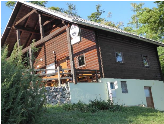
Slika 13: Turistična kmetija Pri Mežnarju

da je vaša krvna slika zaradi premalo gibanja na svežem zraku že malce problematična, le zagriznite kolena gor do cerkve (748 m), tistih pičlih sto višinskih metrov. Klanec je kar usmiljen. Videli boste, da je cerkev tako kot vas vsa bela in snažna, na novo odeta v baker. Zgrajena je bila v začetku 19. stoletja v poznem vaškem baroku, na prazgodovinskem kulturnem prostoru, kjer je od 12. stoletja stal tudi stari Štefan, verjetno lesen. Po sedmih stoletjih je ta mučenec dočakal, kar je tako dolgo iskal, upelil ga je ogenj iz strele. Sedanji Štefan ima na slemenu lično oblikovan strelovod, tako da najprej pomisliš na kak nov kulturni predmet. Stanoviten je: ne moreš vedeti, koliko strel ga je že skušalo preklati. Taki so ti novi časi: odporni proti starim. K sreči dopuščajo sanje, vendar le v samoti, na okrajkih glavnih tokov. Štefanja Gora je pravi kraj zanje. Tisti kamniti obmejki, ki zarasli s šipkom in glogom še zmeraj silijo na dan, govorijo o tem, koliko je bila ta gorska dežela skrčena in kultivirana, ter vzbujajo nostalgичne sanje o žuljih, upognjenih hrbtih in znoju naših prednikov.