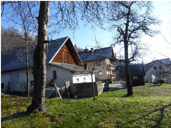
Slika 11: Spodnja Štefanja vas

Včasih so iz kočenskih strmin (Slika 12) na štefanjske obronke spusti orel, mogočen tudi od daleč, celo takrat ko se veje upogibajo pod njim. Če boste po snažnih zelenih rutih preveč rožljali, ko boste tekli k njemu, bo seveda hitro odplahutal.