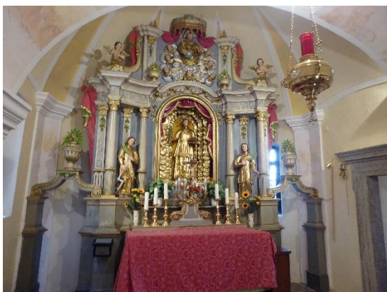
Slika 3: Glavni oltar v cerkvi sv. Štefana na Štafanji Gori

V glavnem oltarju stroje trije diakoni mučenci, ki so bili v starih litanijah vseh svetnikov lepo po vrsti: v tronu je kip sv. Štefana, ob njem sv. Lovrencij in sv. Vincencij. Nad njimi pod baldahinom med angelci v oblakih sedi Bog Oče z žezlom in zemeljsko kroglo (Slika 3).