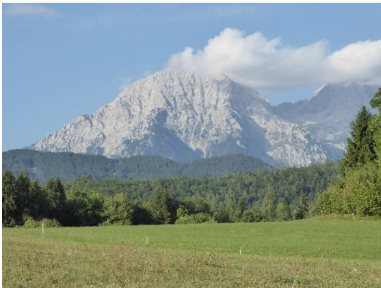
Slika 12: Pogled na Kočno v bližini turistične kmetije Mežnar

Včasih so iz kočenskih strmin (Slika 12) na štefanjske obronke spusti orel, mogočen tudi od daleč, celo takrat ko se veje upogibajo pod njim. Če boste po snažnih zelenih rutih preveč rožljali, ko boste tekli k njemu, bo seveda hitro odplahutal.