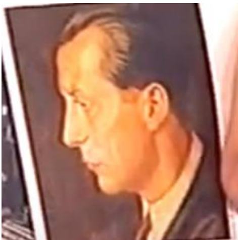
Slika 6: Prvi fašistični voditelj Fracisco Franco Amonde

španskih fašistov, vendar ga republikanci zaprejo, umre v zaporu leta 1936. Kaže se, da je s fašizmom konec v Španiji. Dvignejo se generali 1936, ki služijo v španski koloniji Maroko v severni Afriki. Najbolj znan general je Fracisco Franco Amonde, ki je bil podpihovalec tega fašizma Prima de Avere. Franco ne more pozabiti, da je ta veliki fašist umrel v madridskem zaporu. Kar iz Maroka s španskimi nacionalističnimi četami napade domačo domovino, republikansko Španijo. To je začetek državljanske vojne, ki traja 3 leta. Do leta 1939. Na koncu fašisti triunfirajo nad komunističnim odporom. Komunisti in socialisti, ki predstavljajo republikansko Španijo. Fašisti bojujejo za cerkev in za svojo fašistično ideologijo. Franco leta 1939 zavlada kot diktator Španije. Vlada do leta 1975. Po koncu državljanske vojne se začne v svetu II. svetovna vojna, v kateri Franco namensko ne sodeluje. Noče podprpeti zaveznikov Musolinija in Adolfa Hitlerja, zato da v Španiji ohrani nevtralni red. Dovolj mu je njegove lastne državljanske vojne. Državo hoče čim prej spraviti iz razvalin. Španski narod ga pozna kot Franco de Caudilio, kar pomeni vodja, voditelj. Monarhijo je obnovil že leta 1947. Sam je vladal kot regent oziroma El Caudilio (voditelj). O kralju ni ne duha ne sluha. Do Francove smrti leta 1975.