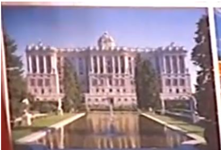
Slika 5: Palacio Real de Madrid

To je rezidenca španskih Borbonov, ki so jo zgradili v 18. stoletju. 10-krat večja od Buckinghamse palače v Londonu. Ogromen momentalni spomenik klasične arhitekture. Borbonu zapustili mestu Madrid. Sama Španija politično do 19. stoletja, ko je Napoleonski udor, je potonila.