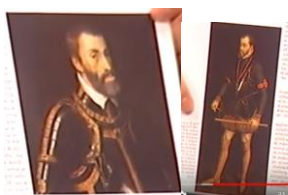
Slika 3: Filip II.