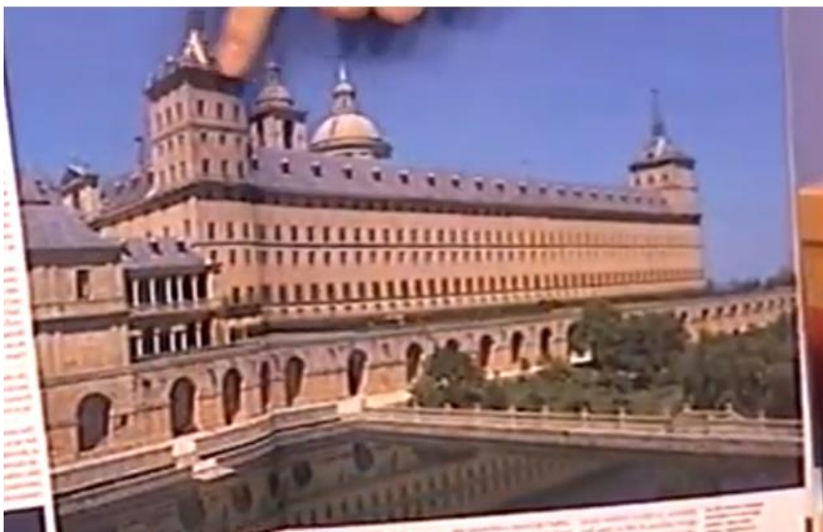
Slika 4: El Escorial

v osrednji Španiji. El Escorial zgrajen v 16 stoletju s strani Filipa II., stroga španska renesansa, ravne linije, brez kakšnih okraskov in podobno. To naj bi bila domovanje, palača, movzolej in grobnica v enem (Slika 4). Tu so pokopani španski hasburški kralji. Tudi s Filipom II. samim. To je primer 1. absolutistične palače v zahodni Evropi. 100 let predno se je gradil Versai v Franciji. Hasburška Španija zagovarja absolutno monarhijo.