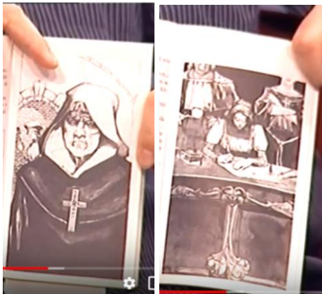
Slika 1: Inkvizitor Tomas de Rorquemada

Tudi to je eden tistih bolj žalostnih dogodkov. Poleg odkritja Amerike v imenu Španske Kastilsko Aragonske krone, pride še do inkvizicije. To spozna Španija 1480. V času srednjega veka v Španiji inkvizicije ni bilo. Inkvizicija v Španiji datira od konca 15. stoletja do leta 1820. Takrat jo ukinejo. Sta Izabela Kastilska in Ferdinand Aragonski tista dva vladarja, ki sta dovolila inkvizicijo na španskih tleh. Na predlog velikega španskega duhovnika. Prvega velikega inkvizitorja Ekvizidor General (generalni ali veliki inkvizitor) Tomás de Torquemada ( klik ), ki je bil judovskega porekla. Postal katoliški duhovnik, prvi veliki inkvizitor zelo neusmiljen, do pregona teh krivovercev v Španiji. Vidimo sliko, zlovešč portret (Slika 1).